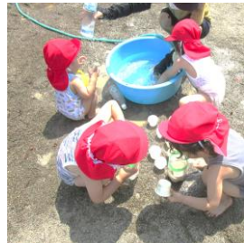
水あそび楽しいね