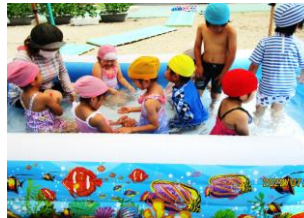
プール遊び 気持ちいいね！